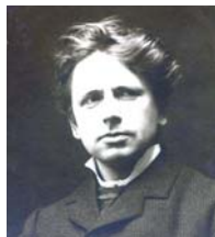
Jeppe Aakjær 1898