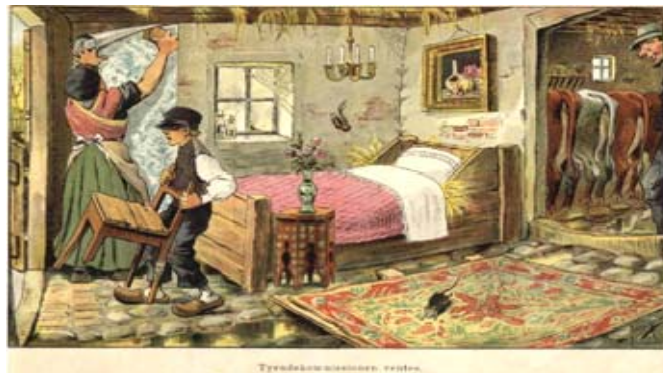
Blæksprutten: Tyendekommissionen ventes!

Året efter "Vredens Børn", bragte Blæksprutten nedenstående tegning, som en ironisk protest mod tyendes elendige forhold på landet.